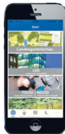
Angebot der Denkmal-BW-App.

tag-des-offenen-denkmals@denkmalpflege-bw.de Ab Anfang September steht die komplette Broschüre auch auf der Homepage der Landesdenkmalpflege als Download zur Verfügung: www.denkmalpflege-bw.de