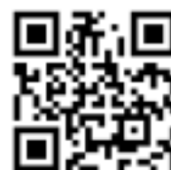
QR-Code zur Denkmal-BW-App.

Seit Mitte 2015 erarbeitet eine interdisziplinäre Arbeitsgruppe unter Federführung des Landesamtes für Denkmalpflege einen Leitfaden für Behörden, Planer, Denkmaleigentümer und Verbände, die sich mit den Themen der Auffindbarkeit, Erreichbarkeit, Zugänglichkeit und Nutzbarkeit von Kulturdenkmälern und den gültigen Rechtsnormen wie der UN-Behindertenrechtskonvention, dem Landesgesetz zur Gleichstellung von Menschen mit Behinderungen oder der Landesbauordnung Baden-Württemberg befasst und über die Einbindung von Verbandsvertretern der Selbsthilfeorganisationen eine hohe Praxisnähe erreicht. Die erarbeiteten Inhalte werden in die Tagung einfließen. So wird in Grundsatzvorträgen versucht, die Belange der Menschen mit Behinderungen und die Grundzüge denkmalfachlichen