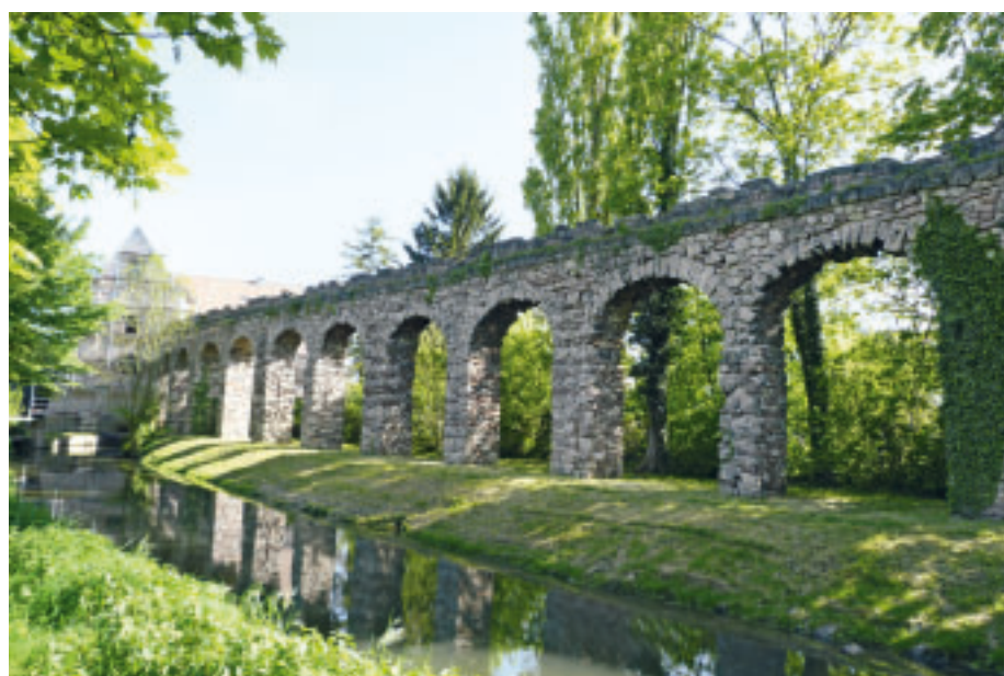
Oberes Wasserwerk in Schwetzingen.