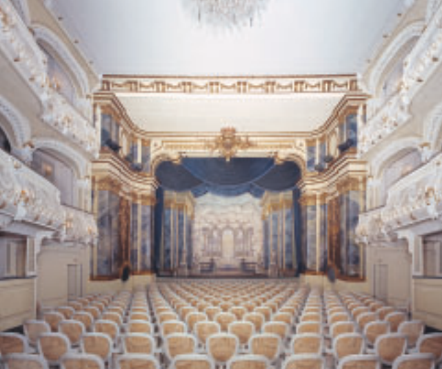
Hoftheater im Schloss Schwetzingen.

kostenfrei in öffentlichen Häusern ausliegen und über das Landesamt für Denkmalpflege zu beziehen sein: